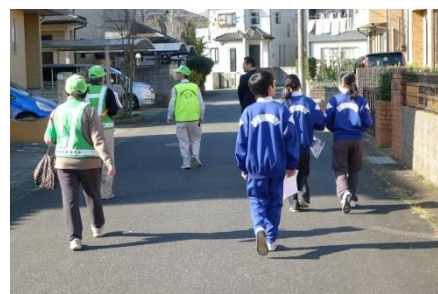
(注) 写真は2枚とも昨年の様子です。