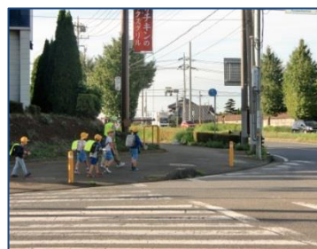
(ランドローム前) 下校時見守り中