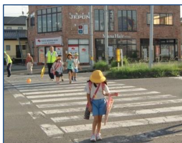
(カスミ前) 下校時見守り中