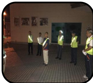
出発前のセレモニーの様子

八原地区でも近頃空き巣被害が頻繁に起きているようです。戸締まりをするのは当たり前ですが、家の周りの整理整頓も効果があるようです。防犯委員会では夜間の防犯パトロールを行いました。今回は城ノ内1, 2丁目でしたがこれからも範囲を変えて行っていきます。