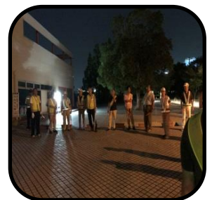
二十数名の御協力をいただきました

八原地区でも近頃空き巣被害が頻繁に起きているようです。戸締まりをするのは当たり前ですが、家の周りの整理整頓も効果があるようです。防犯委員会では夜間の防犯パトロールを行いました。今回は城ノ内1, 2丁目でしたがこれからも範囲を変えて行っていきます。