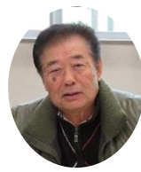
龍ヶ崎市住民自治組織連絡協議会

新年度になり八原地区に引越しされてきた方も多いのではないのでしょうか。自分たちの町に愛着を持つには町の歴史を知ることでも大事です。前号から始まりました「わが町を知ろう」は不定期ではありますが、地元を元を歴史をよく知っている方に龍ヶ崎について教えて頂くコーナーです。