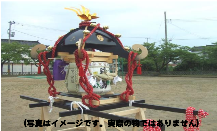
(写真はイメージです。実際の物ではありません)

お祭りになくてはならないのが神輿ではないでしょうか?、去年は、お借りした神輿を担いで夏祭りを盛り上げる事ができました。本年も大勢の皆さんに楽しんでいただける夏祭りにするために、樽神輿を作成することにいたしました。つきましては皆様からのご浄財が助けになります。ご協賛は1口500円、ご芳名は木札に記載して樽神輿に取り付けさせていただきます。皆様のご寄付をお待ちしております。