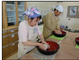
昨年のソバ打ち講座