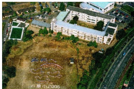
平成 17 年 (2005 年)