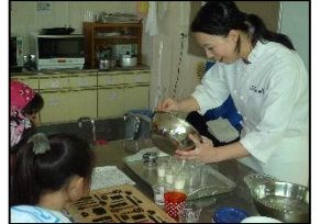
子供向けお菓子講座