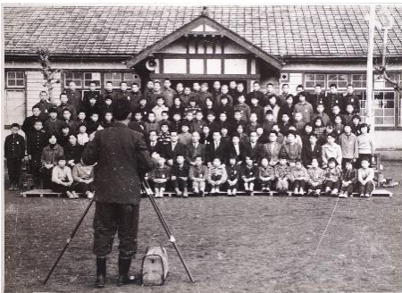
昭和 36 年頃 卒業式の様子