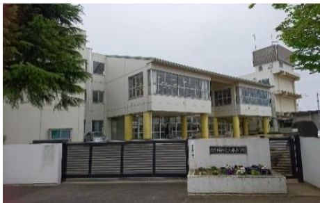
現在の八原小学校正門