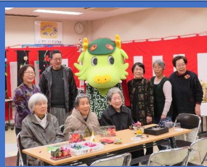
ホーム「あかり」の方々