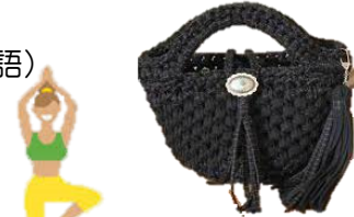
ズパゲッティバッグ