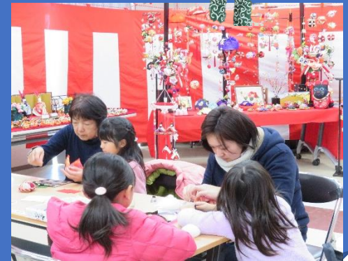
ひな人形作りの様子