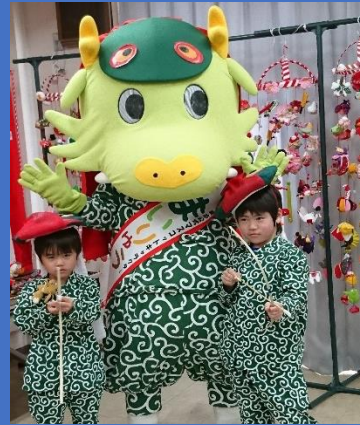
舞男の衣装を着て