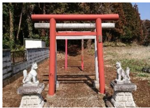
狐の穴があったと言われている奥の院(お穴)