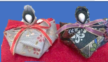
ワークショップの作品