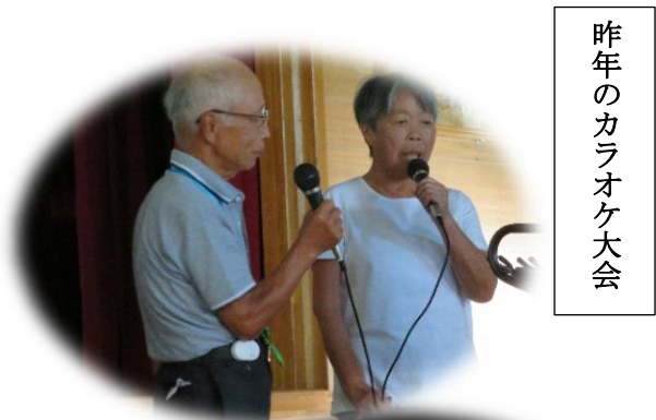
昨年のカラオケ大会