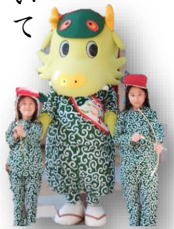
まいりゅう君も舞男の衣装を着ているよ！

龍ヶ崎の撞舞は、平成十一年に国選択無形民俗文化財に、平成二十二年に茨城県無形民俗文化財の指定を受けた、450年以上の歴史ある伝統芸能である。雨乞いや五穀豊穡、疫病除け祈願の意味を込め、八坂神社祇園祭の最終日の夕刻に披露される。場所は根町撞舞通り。祇園祭は通例、7月後半の金・土・日曜日の三日間にわたってとり行われる。