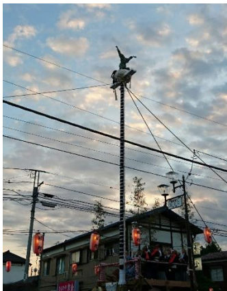
高さ14mの撞柱での演技

（参考資料：龍ヶ崎市歴史民俗資料館「龍ヶ崎市撞舞保存会」文化財団「茨城見聞録」）