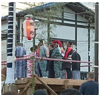
御神酒での清めの儀式

随時募集！ 八原コミュニティセンターでは月二回おこど囃子のお稽古を行っております。 問合せコミセンまで。